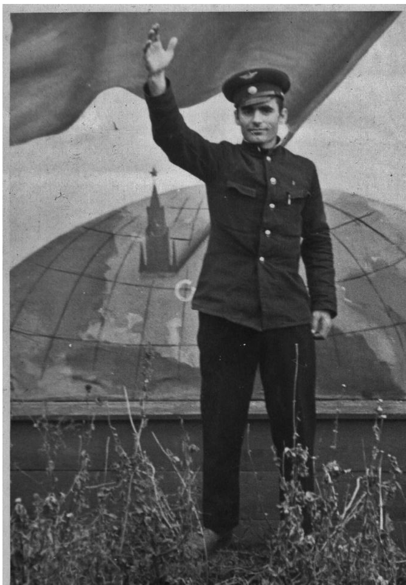
Авиационно-техническое училище (г. Кирсанов Тамбовской области) 1962 год